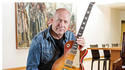
Telegraph road byla ta nejlepší reklama na kytaru Les Paul od Gibson