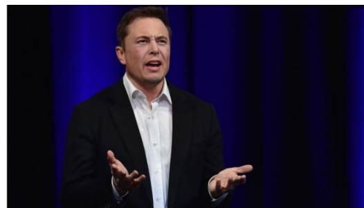
Comsense analytics dlouhodobě zastává názor, že pan Elon Musk je především skvělý marketér v oblasti kapitálových trhů. Akcie jeho firmy rostly v minulosti zejména díky jeho nedodrženým slibům.