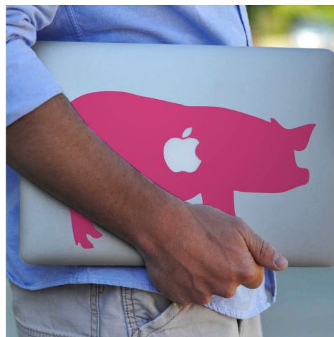
Valuace Apple? Téměř jateční váha.

EU to označuje za jasné porušení pravidel mezinárodního obchodu daných Světovou obchodní organizací (WTO). Evropská komise navíc odmítá vyjednávat pod tlakem hrozeb. Zdůrazňuje, že Američané musí státům EU bez jakýchkoliv předběžných podmínek přiznat trvale platnou výjimku ze zavedených cel. Případná americká cla by dopadla také na české oceláře. Podle analýzy firmy Deloitte, by ročně přišli asi o miliardu korun na maržích. Výrazněji by ale české i evropské firmy mohla poškodit ocel ze zemí, na které se budou vztahovat americká cla. Tato ocel by místo USA mohla skončit v EU. Proti tomu by se EU chtěla bránit zvýšením celních tarifů na zboží, které by se k nim případně z USA přelilo. Trump by tak mohl spustit řetězovou reakci omezování volného obchodu, který vždy patřil k hlavním motorům ekonomického pokroku a blahobytu.